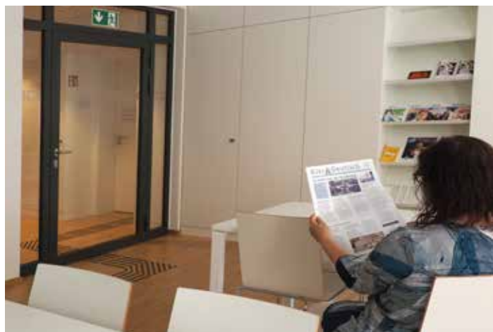
Warte- und Informationsbereich