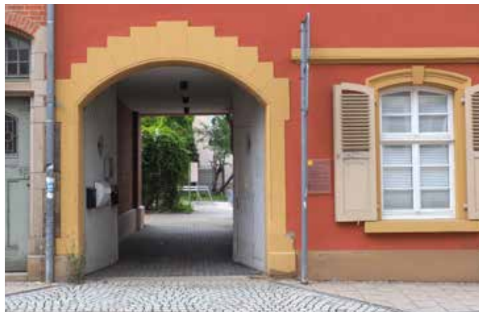
Barrierefreier Zugang über die Mathildenstraße